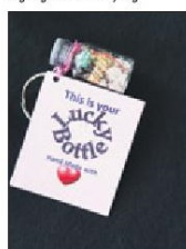
De Lucky Bottle is bij verschillende soevenivinkels verkrijgbaar. Het heeft een grip om inhoud met instructie. Een deel van de opbrengst van deze gerecyclede ampulles gaat naar Stichting Kas di Arte Kòrsou. Hier krijgen jongeren training in verschillende creatieve beroepen.