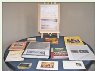
Het nieuwste boek van de kunstenaressen die ook schrijft is.