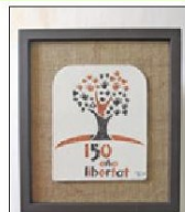
En paneel in Engobetechniek. Hierbij wordt kleiwerk versierd met andere kleuren klei om het ontwerp uit te laten komen. Het collectiepaneel is 50 jaar wij-heid (van de slavernij).

andere panden in Otro banda. Met een dependance in het Christoffelpark. De verkoopwinkel is opgeheven en sinds 2005 doorgegaan als 'Wenk' (antiek-winkel) aan de Witweg 58. De organisatie won verschillende prijzen. Zoals bij de Expo '84, bij de opening industriepark Brievengat, en de Expo '89, toen voor de meest aantrekkelijke stand en ook de beste salegirl. Kas di Arte Kòrsou is tot twee keer toe uitgenomen als uitverwinning door Stichting Johannes Bosco. In 2009 wonnen ze de