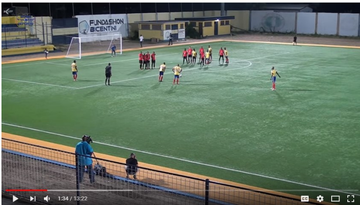
Highlights Futbol FFK C. Dominguito vs J. Colombia 08 04 2018