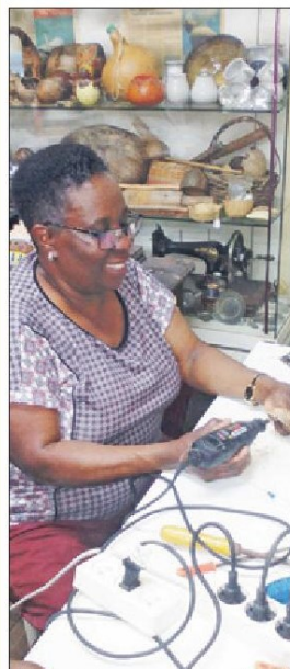
In de workshop Kalkabaarwerking leren de cursisten kalkbasen te zagen en te versieren. Verder wordt kennisgemaakt met zo'n dertig lokale en internationale creaties van kalkabas. Culturele en medicinale aspecten van de kalkaba komen ook aan de orde.