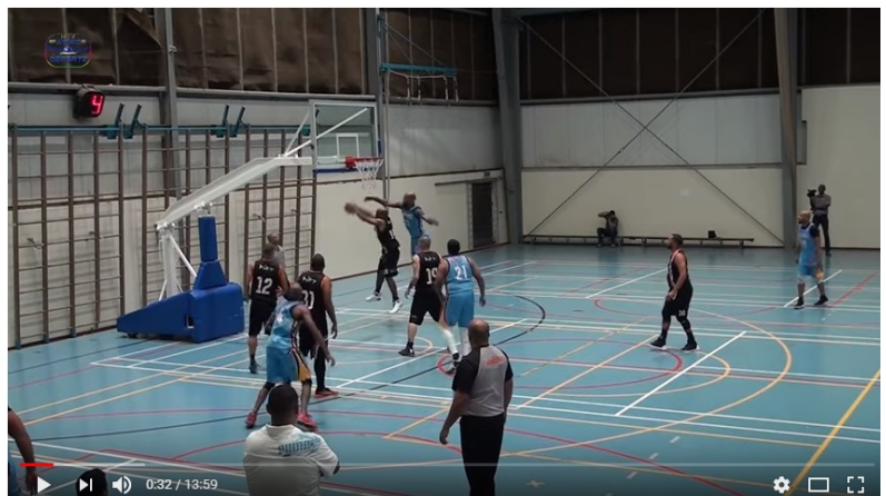
Highlights Basketball 2018 Warriors vs NETS 12 04 2018