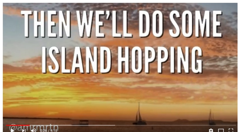
iAM ft D'antonio - Lost in the Caribbean (Lyrical Video)