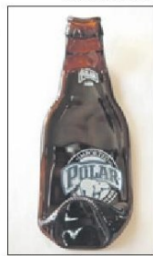
Glass fusingtechniek. De flessen met brandvrije teksten zijn een lust voor het oog en goed voor de recycling.