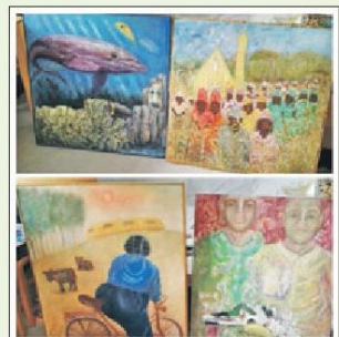
Impulsieve waarnemingen. De schilderijen gaan over een nostalgische gevoelheid na terugkijk uit Nederland.